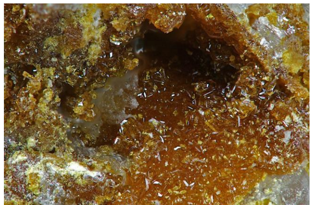
Winstanleyit von der Grand Central Mine Tombstone, Cochise Co., Arizona BB = 2,3 mm, (A000 074)